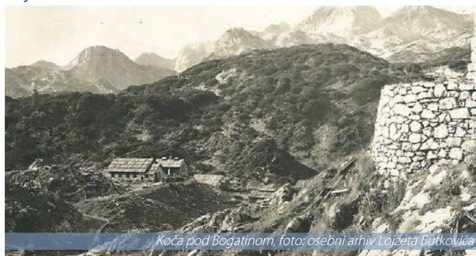
Koča pod Bogatinom

V teh čudnih časih je šel sredi avgusta tiho mimo nas pomemben jubilej bohinskega planinstva – 90 let od ustanovitve bohinske podružnice Slovenskega planinskega društva (SPD).