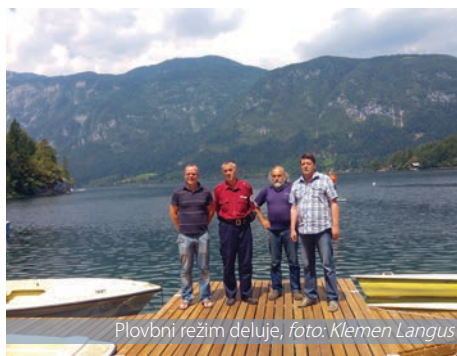
Plovni režim deluje, foto: Klemen Langus

oreh, nenazadnje gre za največje sladkovodno jezero v Sloveniji. Ljubezen do tega jezera pa ni izražena samo skozi lokalno prebivalstvo, ampak tudi skozi vse obiskovalce, ki to jezero koristijo. Plovni režim je pokazal, da se razmere na Bohinjskem jezeru da urediti, da so vsi uporabniki jezera lahko zadovoljni: gostje v smislu tega, da je njihovo doživetje tako, kot ga skozi oglaševanje obljublamo, domačini pa zato, ker s tem jezerom živijo že tisočletja.«