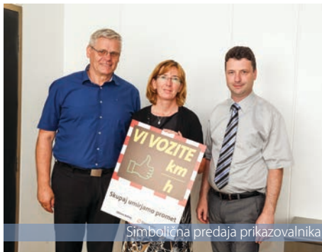
Simbolična predaja prikazovalnika

Zavoda dr. Janeza Mencingerja Bohinjska Bistrica, v sklopu katerega delujeta osnovna šola in vrtec, potekal varneje. Prikazovalnik je del vseslovenskega projekta Skupaj umirjamo promet, v katerem bo ob sofinanciranju največje slovenske zavarovalnice 19 slovenskih občin aktivno umirjalo promet v bližini šol, vrtecev in na šolskih poteh.