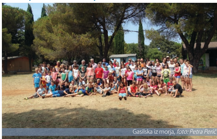
Gasilska iz morja

Tudi letos se je gasilska mladina iz GZ Bled - Bohinj (Bohinj in Selo) odpravila na letovanje v kamp Pinea. Zveza društev prijateljev mladine Jesenice nas je gostila od 6. 7. 2016 do 13. 7. 2016. Letovanja se je udeležilo rekordno število otrok, in sicer kar 74, in 9 mentorjev.