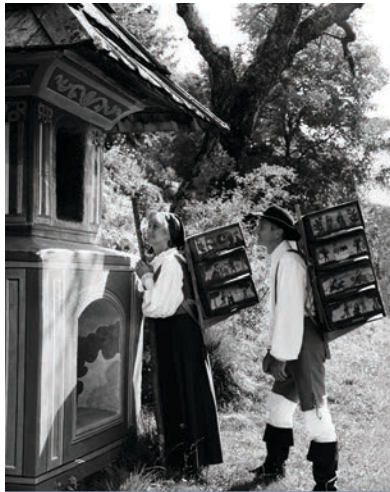
Pred kapelico

preizkušal, nato pa zavrzel iz podobnih argumentov kakor mnogi ostali čebelarji. Toda njegov nemirni, ustvarjalni duh ni počival. Želel je ustvariti moderen panj, ki bi zadovoljeval potrebe slovenskih čebelarjev in ki bi se navezoval na tradicijo. To pomeni, da bi bil praktičen za prevažanje na paše ter da bi se ga lahko zlagalo v čebelnjak, kot so nekdanji naši predniki zlagali kranjiče. Pri snovanju mu je kot vzorec služil tako imenovani »listovni« panj nemškega učitelja Albertija. Temeljito ga je predelal in ga po večletnih poizkusih leta 1910 končno ponudil slovenski čebelarji