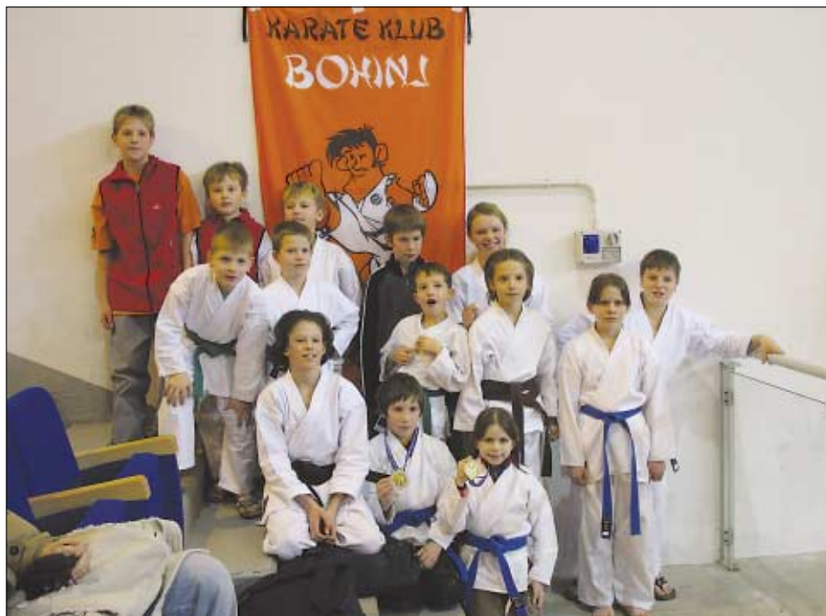
Člani Karate kluba Bohinj osvajajo medalje v najmlajših kategorijah.

Karate je primeren za vsakega brez omejitev. V klub sprejmejo vsakogar ne glede na